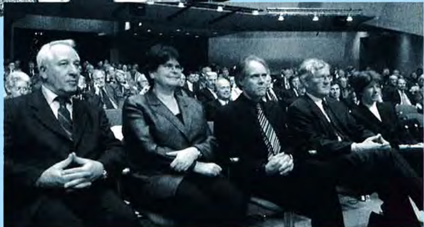
Sessione primaverile Camere Federali in Ticino