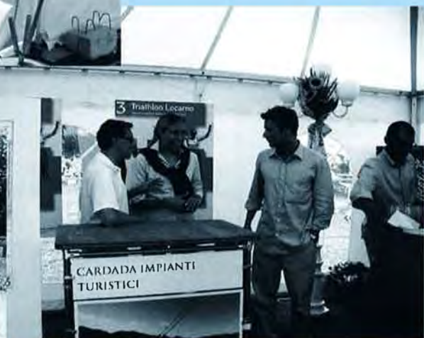
Ticino primo cantone ospite a Ironman Switzerland, Zurigo, agosto 2001