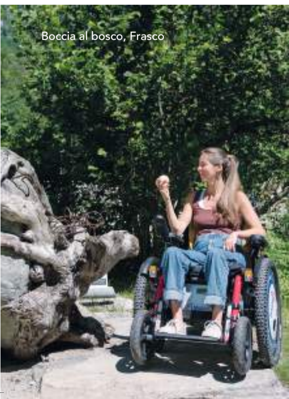
Boccia al bosco, Frasco