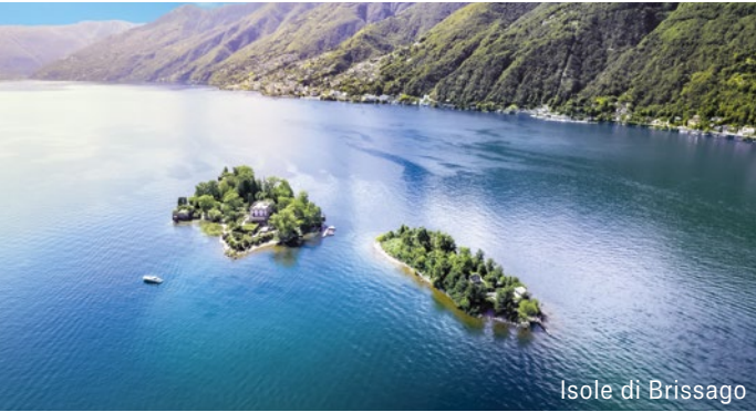
Isole di Brissago