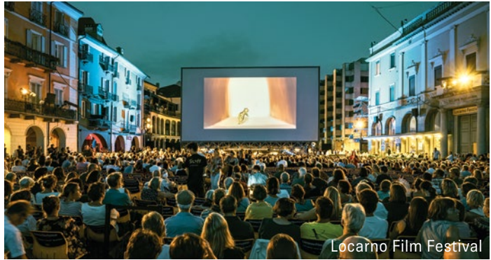
Locarno Film Festival